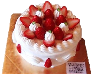
11月末頃までお休みです

6月中旬にて、いちごの季節が終わります。しばらくの間、いちごのデコレーションなどは終了させていただきます。11月末頃より始められる予定です。どうぞご了承下さい。