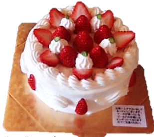
いちごのデコレーション