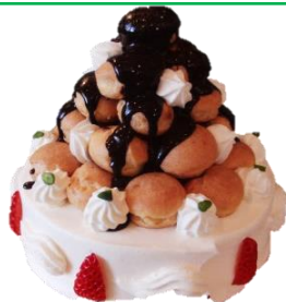
クロカンフッシュ