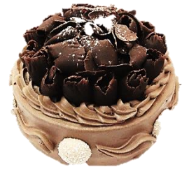
チョコレートのデコレーション