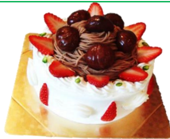
栗のデコレーション