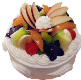
フルーツのデコレーション